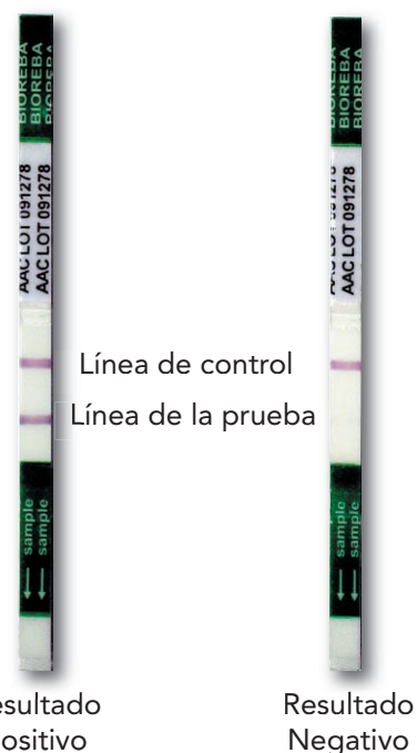
Fig. 5: Tiras reactivas

Nota: El homogenizador manual (Art. No. 40010) es opcional y no viene incluido en el kit completo.