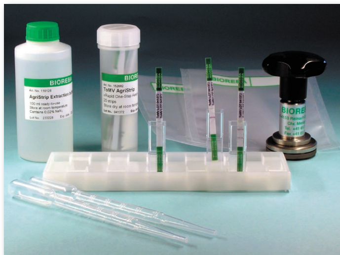
Fig. 6: Kit completo AgriStrip (25 ensayos)

Existen tres versiones disponibles de AgriStrip : kit completo (Figura 6) o a granel, con 25 o 100 tiras, respectivamente. Consulte la página de Internet www.bioreba.com para obtener un listado actualizado de las pruebas disponibles en el formato AgriStrip.